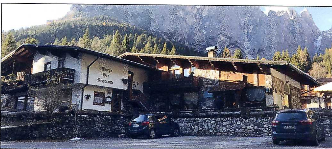
Per agevolare gli arcieri il Comitato organizzatore ha scelto di assegnare ad ogni campo un ristorante di riferimento con adeguati parcheggi. Dall'alto (in senso orario): Al Cacciatore, Cant del Gal, Chalet Piereni e Ritonda.

ce range, uno per i cuccioli e uno per gli adulti, allestiti nelle vicinanze della tensostruttura. I practice range saranno a disposizione anche nei due giorni di gara dalle 7.30 alle 9.00. Ricordiamo che le iscrizioni sono aperte dal 16 gennaio 2018 tramite il gestionale Fiarc e si chiuderanno il 28 febbraio. Chi volesse prenotare strutture alberghiere per la manifestazione si può appoggiare a Primiero Iniziative (info@primiero.com), che ha concordato con i ristoratori della valle un pacchetto dedicato agli arcieri con particolari agevolazioni. Gli amici